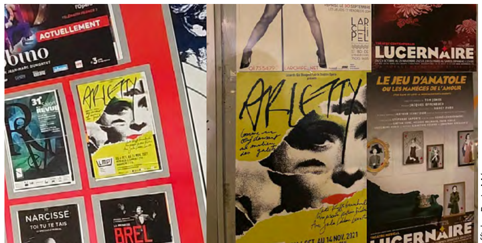
Vidéos Sortie de spectacle Avignon